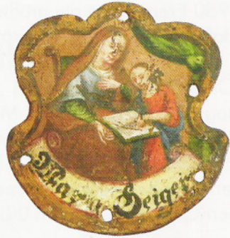
Kirchenstuhlschild, 19. Jh.